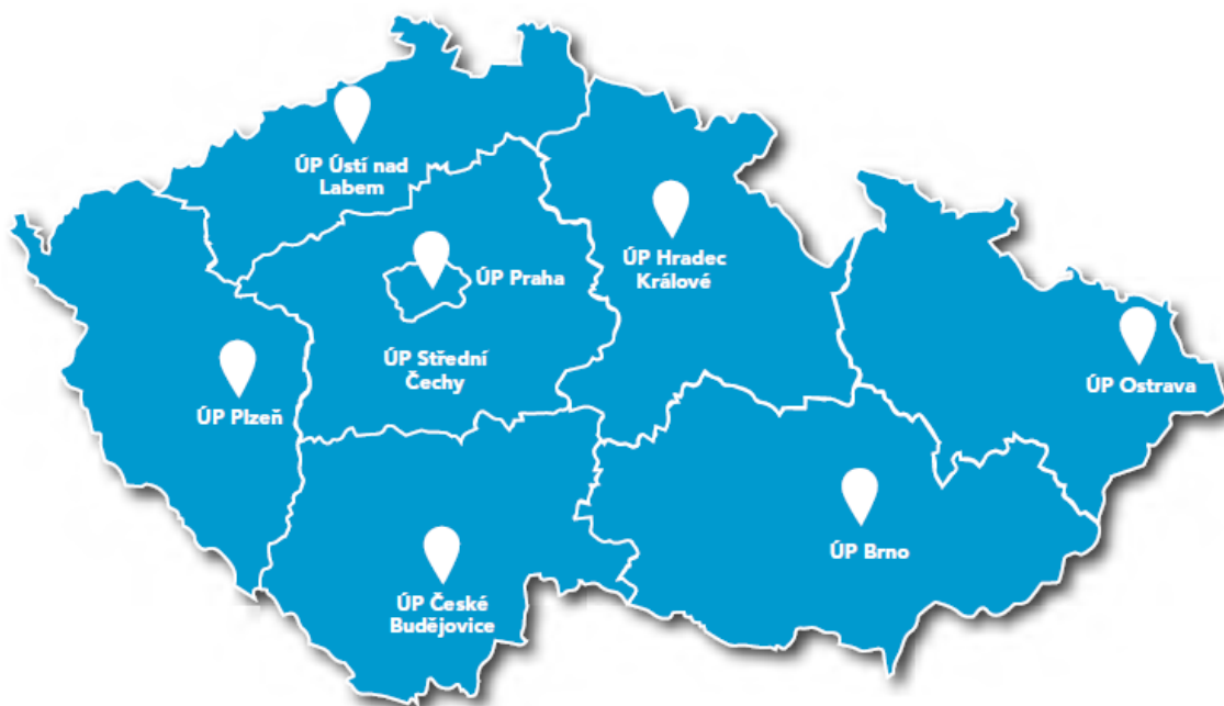
Obrázek č. 1: Územní pracoviště ÚZSVM